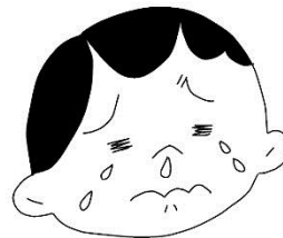
・目のかゆみ ・鼻水・鼻づまり