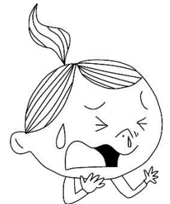
・激しいくしゃみ