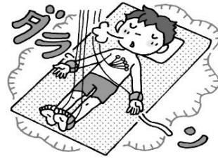
③ダラーンと力を抜いて 動かない

しんでんずけんさはまったくいたくありません。 しずかに横になっていれば、1分ほどで終了します。あんしんしてうけてくださいね。