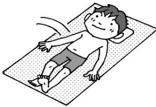
①ベッドに横になります