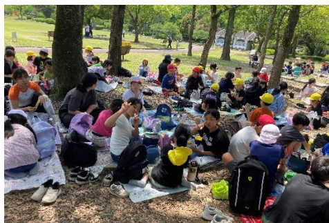
運動公園でおいしそうにお弁当を食べる子供たち(#.^.#)