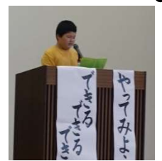
代表児童の挨拶 最上級生としての決意を堂々と発表しました。

学級や学校をより良く、楽しくする主役は子どもたちです。誰かに任せるとはなく、一人ひとりがより良くしたい、楽しくしたいと、まずは「やってみる」ことを大切にしてみたいと考えました。うまくいかないことがあってもそれは当たり前。そんな時には、自分の行動を振り返って、うまくいく方法を考えたり、誰かがサポートを受けたりすれば、それも大切な勉強です。もちろん、職員は子どもたちの味方です。力を伸ばすよう支えていきます。