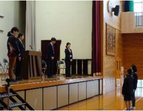
着任式での児童歓迎の挨拶

ドキ、キウキウで迎えた始業式。 四月七日、学校に元気な子どもたちが帰ってきました。校舎や運動場に響く元気な子どもたちの元気な声がエネルギーとなり、学校が動き出しました。 新年度、新たに四名の職員を迎えました。計二十三名の職員が丸と一つで教育活動を進めてまいります。これまで同様、本校の教育活動へのご理解とご協力をお願いいたします。