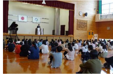
始業式 合言葉は「やってみよう！」

ドキ、キウキウで迎えた始業式。 四月七日、学校に元気な子どもたちが帰ってきました。校舎や運動場に響く元気な子どもたちの元気な声がエネルギーとなり、学校が動き出しました。 新年度、新たに四名の職員を迎えました。計二十三名の職員が丸と一つで教育活動を進めてまいります。これまで同様、本校の教育活動へのご理解とご協力をお願いいたします。