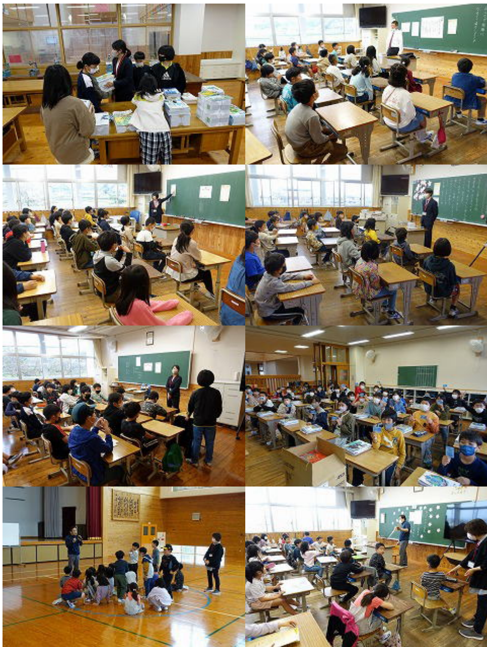
始業式後の学級活動の様子です。新しい教科書、新しい教室、新しい担任の先生との出会い、これからの学校生活を頑張ろうとする気持ちが子どもたちの表情に表れていました。