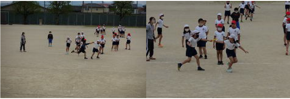
リレー練習、盛り上がってきました！