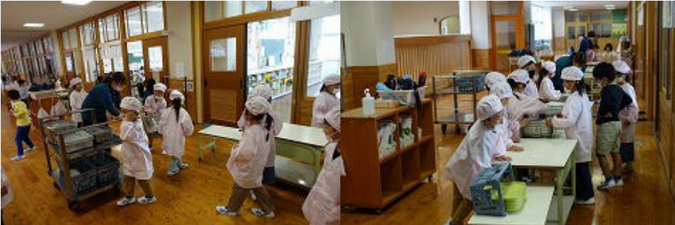
1年生の給食準備の動きも様になってきましたよ。準備にかかる時間も短くなりました。