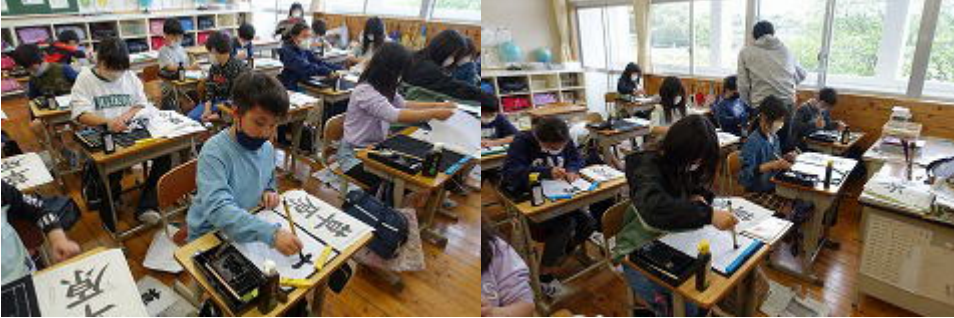
教頭先生と書写（毛筆）の学習をする5年生。文字を美しく書くことも大切な目的の一つですが、自分の文化を知ること、日本人の生き方につながる大切なことです。