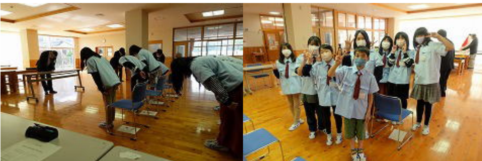
4月20日の放課後に、交通少年団の入団式がありました。今年は、6年生8名です。大切な命を守る活動です。他の子どもたちの模範となって頑張ってください。