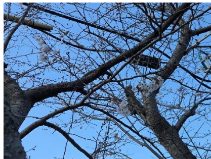
3月23日 職員駐車場の桜

また、本日24日(火)に修了式を行いました。通知表「かがやき」には、担任から子どもたちの学習や生活でがんばったことが記入されています。一人一人の通知表を読ませていただき、1年間の様子を感じ取ることができました。4月からは一つ学年が上がります。5年生は高来西小学校の新しいリーダーとして、また1年生は新入生のお兄さん、お姉さんとして、これまでとまた違った一面が見られることを期待します。みんなで一緒にがんばりましょう。